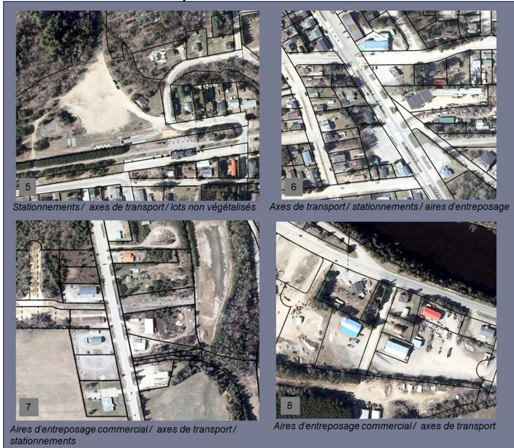
CARTE 3 ILOTS DE CHALEUR 2020-2022