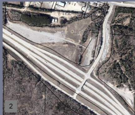
2 Lots vacants gravelés / route 117