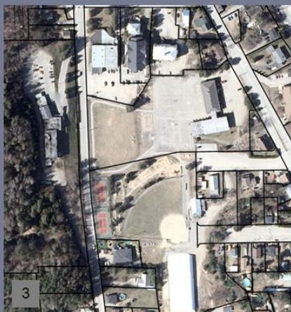
3 Cour d'école / stationnements / aire de jeux