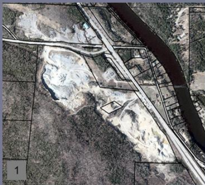
1 Carrières / industries lourdes / route 117