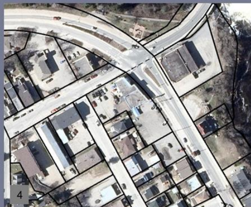
4 Stationnements / axes de transport / lots non végétalisés