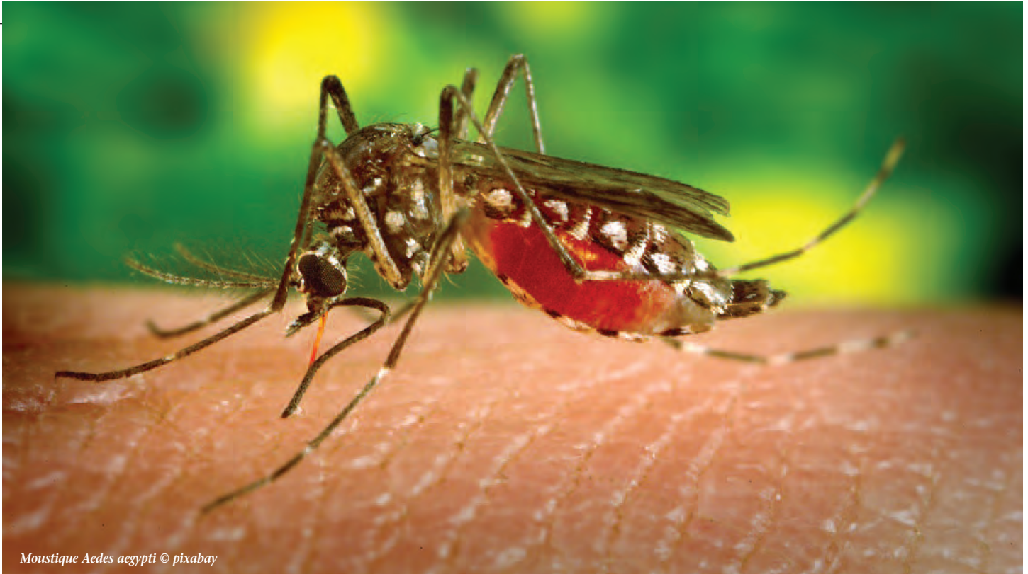
Moustique Aedes aegypti

de l'homme, certes son confort est augmenté, mais sa qualité de vie s'en retrouve améliorée. Dû au coût élevé d'un programme de contrôle biologique, les endroits qui le demandent sont ceux avec une réelle problématique de nuisance. Dans plusieurs cas, on ne parle pas d'être confortable, mais simplement d'être capable de profiter des activités extérieures. Il ne faut pas oublier que les piqûres et/ou les répulsifs peuvent provoquer d'intense réactions allergiques (Feuillet-Dassonval et al. 2006). Plusieurs garderies et écoles limitent leurs sorties extérieures pendant les périodes critiques, car les parents s'opposent à l'utilisation de répulsifs. De plus, plusieurs études arrivent à la conclusion que même en l'absence de transmission de maladie, une infestation de moustiques a un impact négatif sur la santé et, qu'en présence d'un programme de contrôle, l'activité physique des enfants est plus importante (Von Hirsch and Becker 2009; Worobey et al. 2013; Halasa et al. 2014). Ce constat prend son importance quand on sait que le temps consacré aux activités à l'extérieur influence le développe-